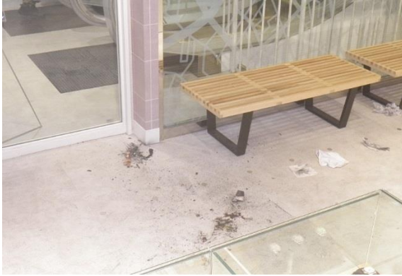
写真3-1 店舗内出火箇所の状況