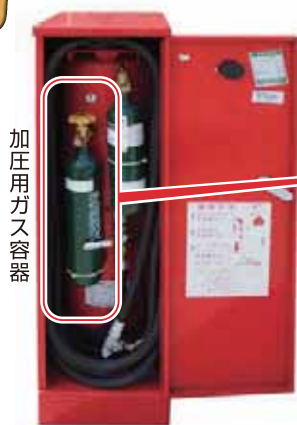
移動式粉末消火設備