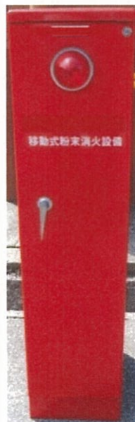
移動式粉末消火設備