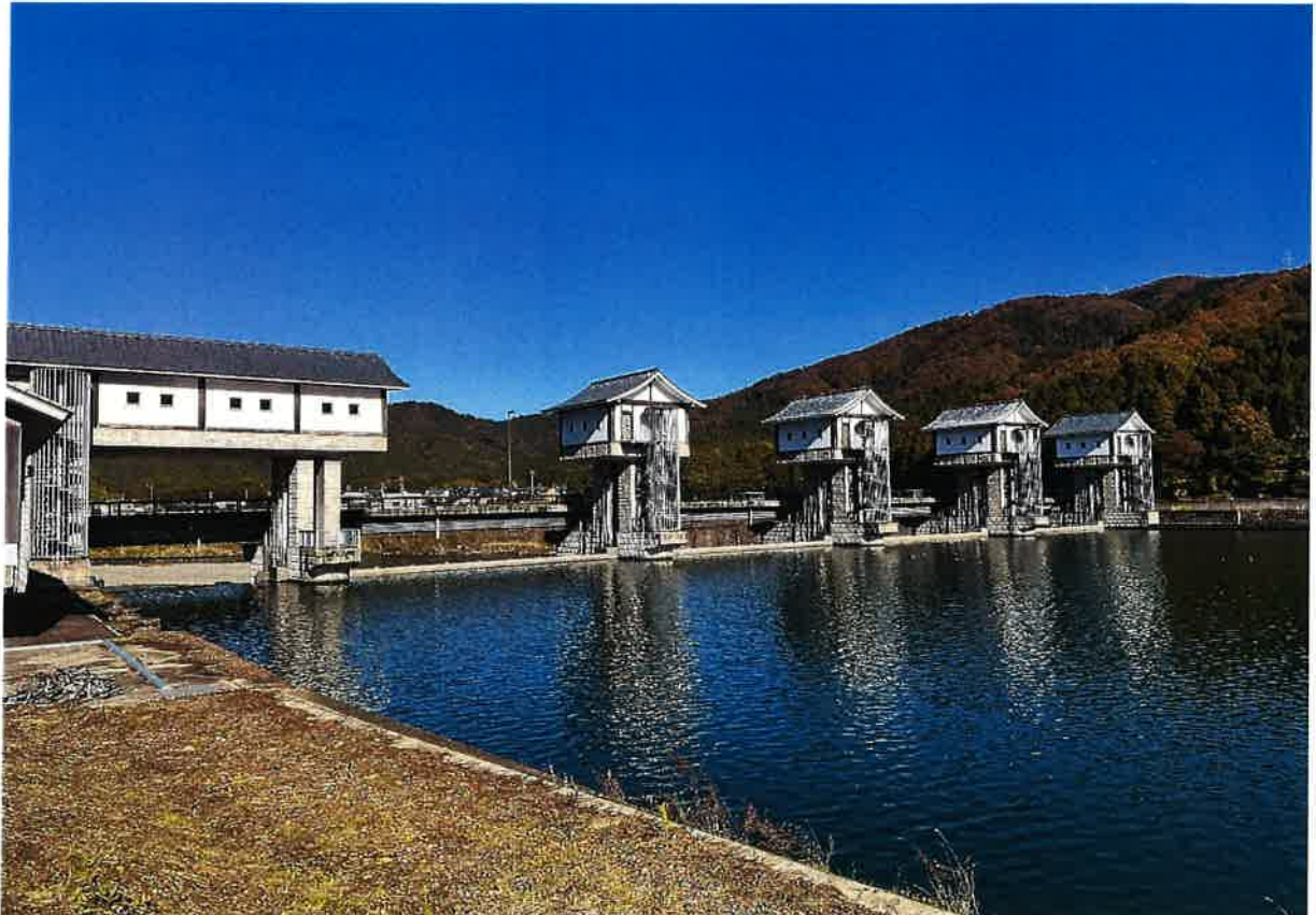
写真：福井市 一乗谷あさくら水の駅 足羽川水門（撮影日：令和4年11月18日快晴）